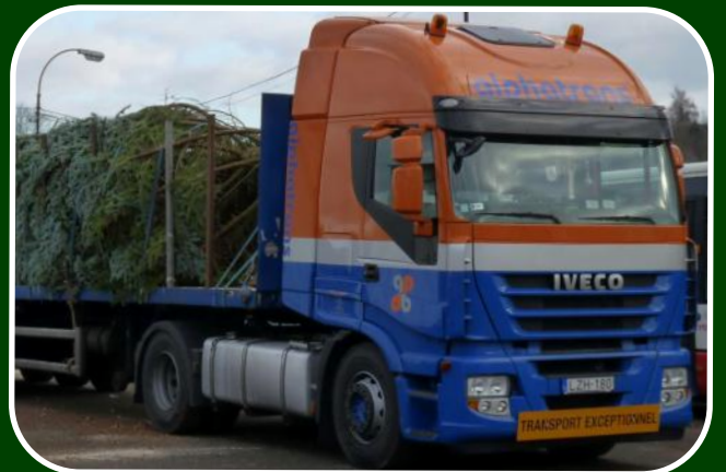
Klaar voor transport door Alpatrans