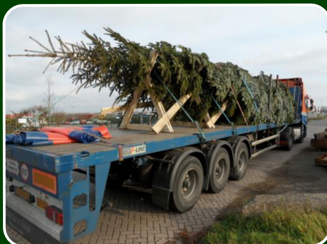
De aankomst in Brielle