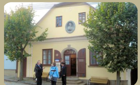
Het geboortehuis van Havlíček Borovský

Na de lunch vertrekken de delegaties in een minibus naar het 18