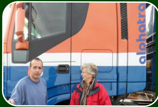
Links de goed Engels sprekende chauffeur, die wat lekkers mee kreeg voor de terugreis.