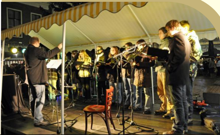
Beelden uit 2010