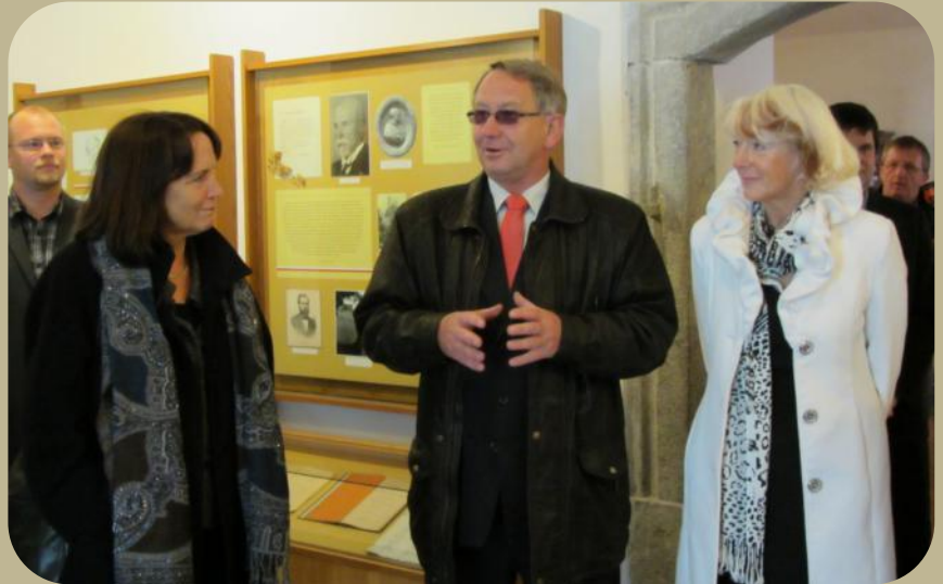
Ontvangst door de burgemeester van Havlíčkova Borová.

In aanwezigheid van een afvaardiging van de regio (kraj) Vysočina (waar Havlíčkův Brod deel van uitmaakt) en de ambas-