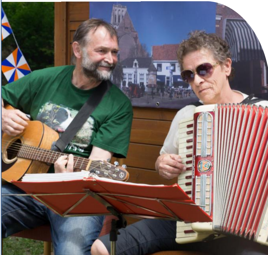
Waar Tsjechen en Briellenaren samen zijn is altijd muziek