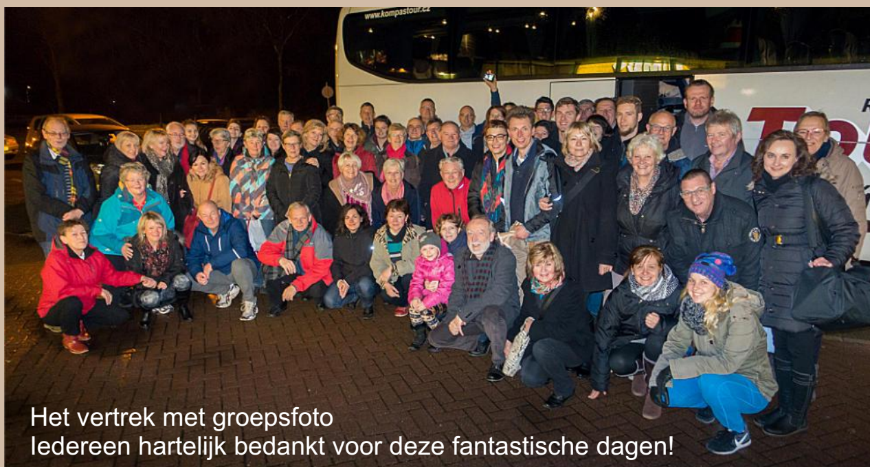
Het vertrek met groepsfoto Iedereen hartelijk bedankt voor deze fantastische dagen!